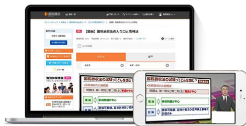
基本講座（動画講座）

全ての講座は、スマートフォン、タブレット、パソコンで受講できますので、忙しい方でも、通勤時間や移動時間、休み時間などのスキマ時間を活用して、無理なく学習を続けることができます。