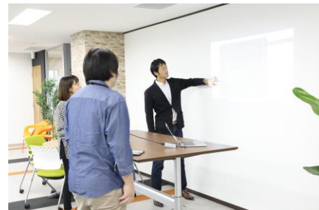
スタンディング・ミーティング