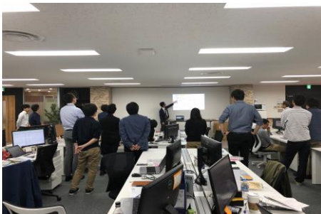
執務スペースも広くなりました。