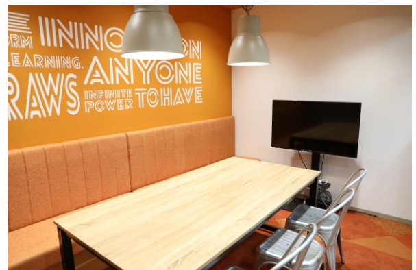
自由な発想で革新を生み出す！カジュアル会議室