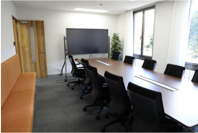
清水谷公園に面した大会議室。春は桜、秋は紅葉がきれいとのこと。