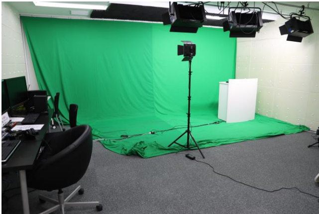
本社内に本格的動画撮影スタジオを2つ設置しました。機材設備も刷新。