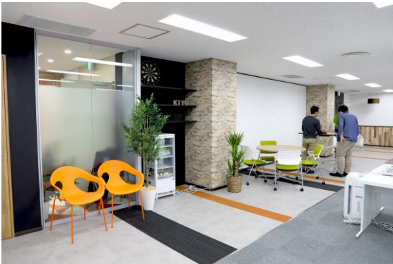
シームレスなオープンスペース

あわせて新社屋では、セミナールームを新設いたしました。Webでのサービス提供だけでは受講者の不安を完全に取り除くことはできません。個人向け資格取得事業では、受講者のモチベーションを高めるオフ会や、合格率を高めるためのオプション講座を開催し、受講者の満足度、合格率を上げるための企画を推進します。法人向け事業でも、公開講座開催や、eラーニングと集合研修を組み合わせた新サービスなどでセミナールームを活用してまいります。