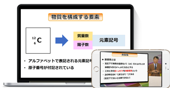
基本講座（動画講座）

当社のeラーニング「通勤講座」は、本コースが加わり、計20コースになります。有料受講者も年々増加しており、2万人（2017年9月時点）を超えています。