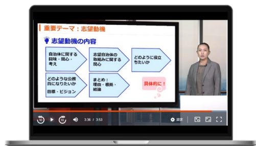
キャリア・コンサルタント講師の面接講座

また、役者による面接再現動画で、所作が重要となる警察官・消防官採用面接における立ち振る舞いを視覚的に学習することで、万全の面接対策を行います。