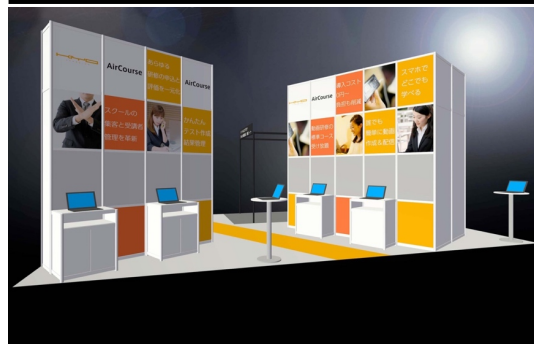
動画講座の制作体験や各種セミナーを開催