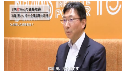
合格者インタビュー放送中

そういった状況の中でいつでも学習でき、わかりやすい動画で、しかも安価に受講できるオンライン講座がこれら悩みを解決することから、資格取得のための学習法もオンライン講座へとシフトし、多くのユーザーにご支持を頂いています。