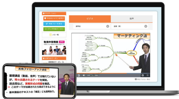
直前対策講座（動画講座）

直前対策講座には、科目ごとに冊子版のテキスト（講義テキスト、解答・解説編）があり、ご注文後に配送させていただきます。冊子は、試験で出題されるポイントが整理されているため、試験前の見直しなどに活用いただけます。本講座で、最も重要な直前期の勉強を効率的に行い、合格を勝ち取っていただければ幸いです。※画像はイメージです