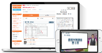
解説講座（動画講座）

※2020年4月15日から5月10日まで「直前対策早割キャンペーン」を実施しています。