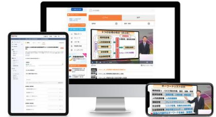
基本講座(動画講座)

マネジメント知識である総合監理技術についてポイントを整理して学習し、論文ではストーリーの組み立てと時間内に書き終えるスキルを身につけます。