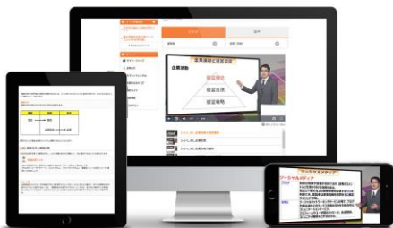
基本講座 (動画講座)