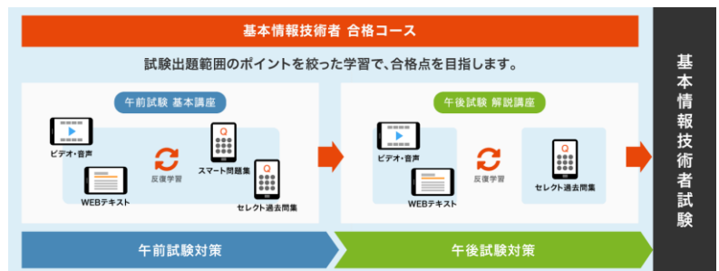
「基本情報技術者 合格コース」の流れ

★基本情報技術者 合格コース 内容: 全94講座 WEBテキスト・問題集付き ¥35,980 (税込)